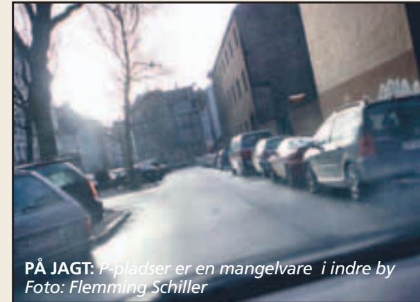
PÅ JAGT: P-pladser er en mangelvare i indre by

Læser forventer færre ledige parkeringspladser på Gammelholm efter mad-mekkas indtog.