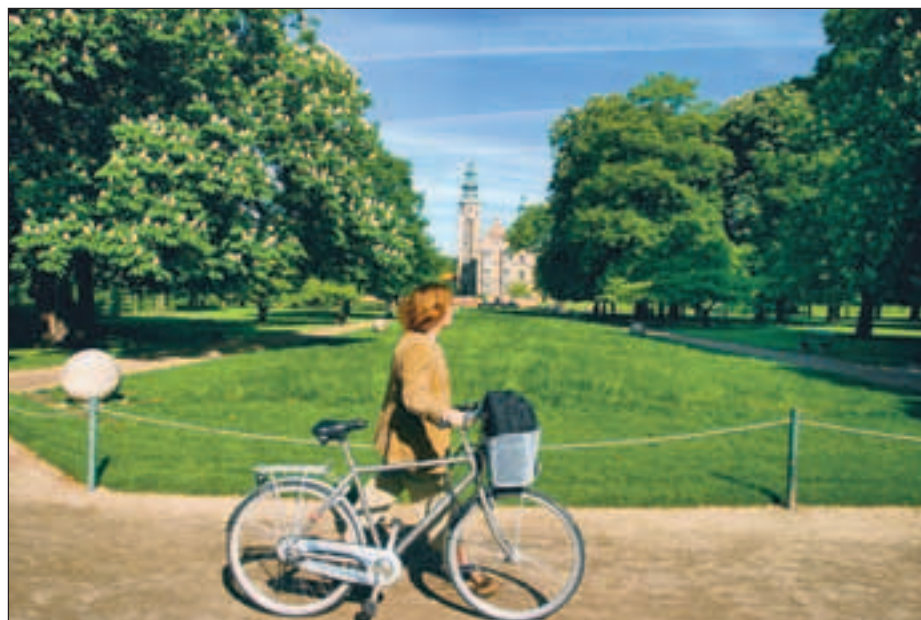
UGENS TEMAFOTO: En cyklist slår en smutvej gennem Kongens Have. Billedet er som altid taget mandag morgen kl. ni.